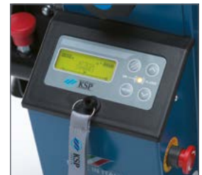
Nuevo panel de control digital que permite introducir al cuidador diversos parámetros (velocidad, modo de subir las escaleras: individualmente/ciclo continuado...) garantizando un uso seguro y simple del sube escaleras.