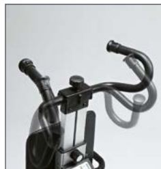
Timón regulable en altura y ajustable para adaptarlo al cuidador.