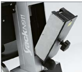
Batería desmontable para facilitar la recarga.

El Yack es el salva escaleras que permite subir y bajar escaleras rectas y de caracol. Se va adaptando a las necesidades del paciente, pasando del modo asiento (Yack 961) al modo silla de ruedas (Yack 962 / 963). Desmontable en diferentes secciones para facilitar su traslado. Con batería desmontable que permite su recarga sin mover todo el equipo.