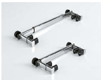
Barra ajustable para el Yack 962 y Yack 963.