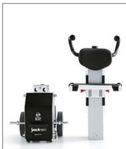
Desmontable en diferentes secciones: mástil, columna y asiento (según modelo), lo que facilita su transporte.