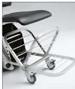
En el Yack 961 los reposabrazos y reposapiés son abatibles para mayor confort del usuario.